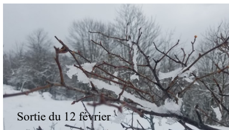
Sortie du 12 février