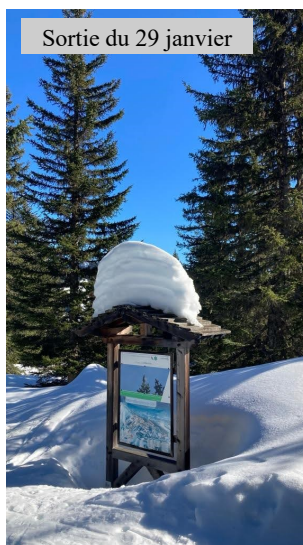
Sortie du 29 janvier