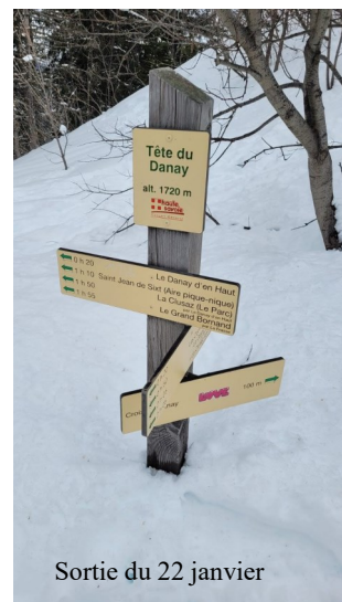
Sortie du 22 janvier