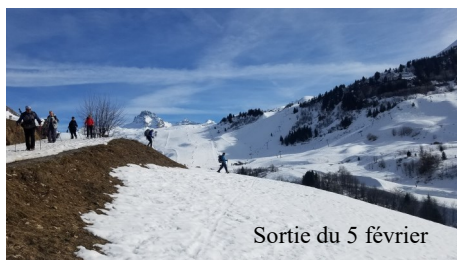
Sortie du 5 février

49 participants au repas de fin de saison au restaurant l'Observatoire au Salève.