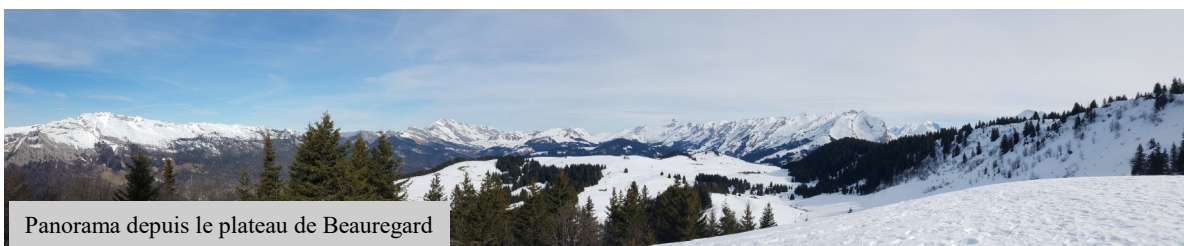
Panorama depuis le plateau de Beauregard